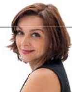
AUTORKOU TEXTU JE Ing. Pavla Berková,

Naše agentura ví, jak uchazeče správně prověřit, a to nejen na základě testů. Díky tomu už několik let pomáháme budovat úspěšné kolektivy v oblasti cestovního ruchu a gastronomie. Dream Job má zkušenosti jak při vyhledávání a efektivním hospodaření s lidskými zdroji, tak i při sestavování pracovních i realizačních týmů. Náš profesionální přístup v této oblasti může napomoci postavit dream team třeba i pro vás. ■